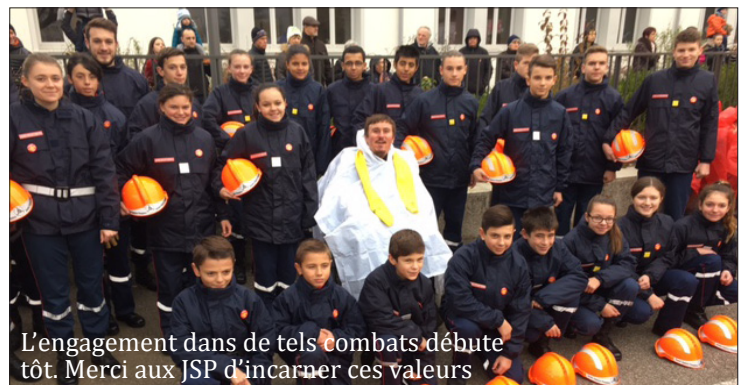
L'engagement dans de tels combats débute tôt. Merci aux JSP d'incarner ces valeurs

Votre aide est importante pour chaque patient, du plus jeune au plus âgé.